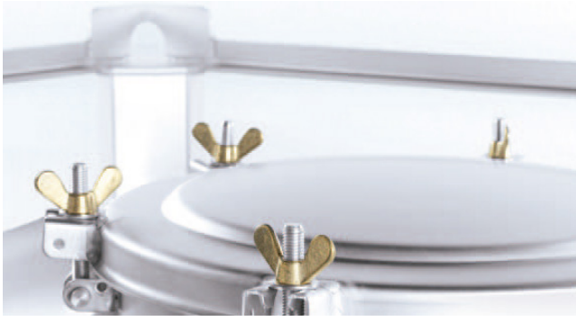
Mannlochdeckel in DN400 und Lebensmittel- bzw. Pharmakonform. Spannringdeckel oder Schraubdeckel mit Scharnier möglich.